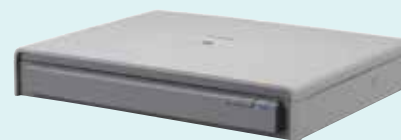
Glace d'exposition A3 Flatbed 201