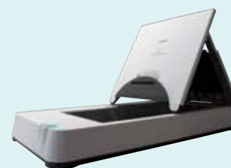
Glace d'exposition A4 Flatbed 101

Les scanners DR-C225/W ont été conçus pour faciliter la numérisation grâce à des fonctionnalités intuitives. Le mode entièrement automatique (avec le logiciel CaptureOnTouch) propose les meilleurs réglages pour les paramètres principaux des documents – soit la détection de l'orientation du texte, la détection du format de page, la couleur, la résolution et la suppression de pages blanches, ce qui permet d'économiser du temps et du travail.