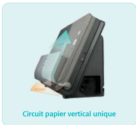
Circuit papier vertical unique

Le circuit d'alimentation papier vertical permet au scanner DR-C225/W d'afficher le plus faible encombrement de sa catégorie. De plus, la conception astucieuse du passage des câbles permet d'appuyer ces appareils directement contre un mur ou bien de les placer sur un plan de travail dont la surface est limitée.